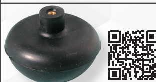
05312 SFERA IN GOMMA CON NOTTOLINO OTTONE