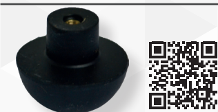
05308 SFERA CON NOTTOLINO OTTONE 'CATIS'