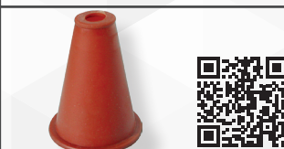
05316 CONO IN GOMMA TRASPARENTE