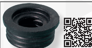
05298 MORSETTO IN GOMMA NERA Ø 40 PER CURVE TECNICHE