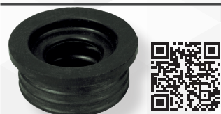
05300 MORSETTO IN GOMMA NERA Ø 50 PER CURVE TECNICHE