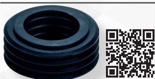
05296 MORSETTO IN GOMMA NERA Ø 55 PER CASSETTA INCASSO