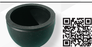
05314 SFERA IN GOMMA NERA PER 'SIAS' E 'RAMO'