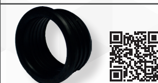
05306 MORSETTO IN GOMMA NERA Ø 50 PER CURVE TECNICHE 'NICOLL'