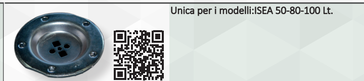
Unica per i modelli: ISEA 50-80-100 Lt.