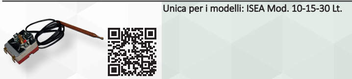
Unica per i modelli: ISEA Mod. 10-15-30 Lt.