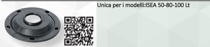
Unica per i modelli: ISEA 50-80-100 Lt