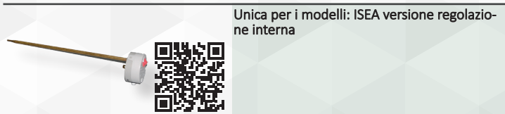
Unica per i modelli: ISEA versione regolazione interna