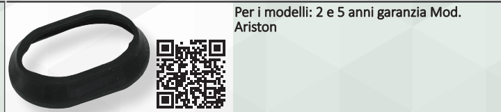
Per i modelli: 2 e 5 anni garanzia Mod. Ariston