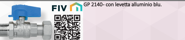
GP 2140- con levetta alluminio blu.