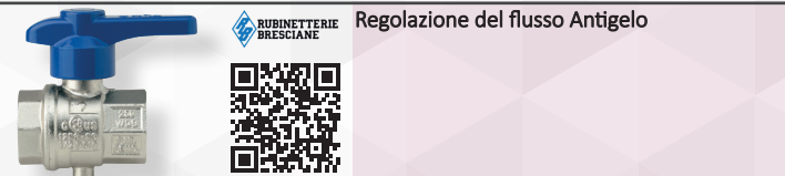
Regolazione del flusso Antigelo