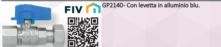
GP2140- Con levetta in alluminio blu.