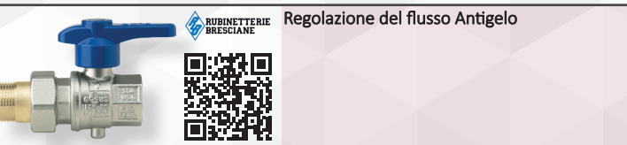
Regolazione del flusso Antigelo