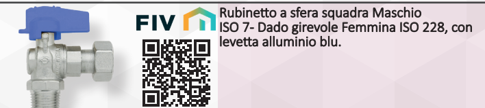
Rubinetto a sfera squadra Maschio ISO 7- Dado girevole Femmina ISO 228, con levetta alluminio blu.