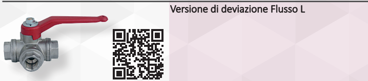
Versione di deviazione Flusso L