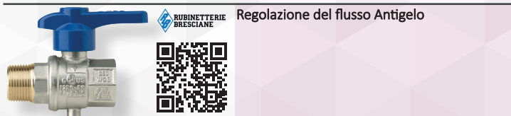
Regolazione del flusso Antigelo