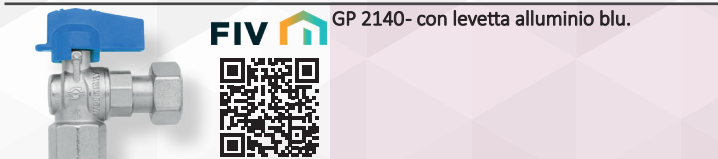
GP 2140- con levetta alluminio blu.