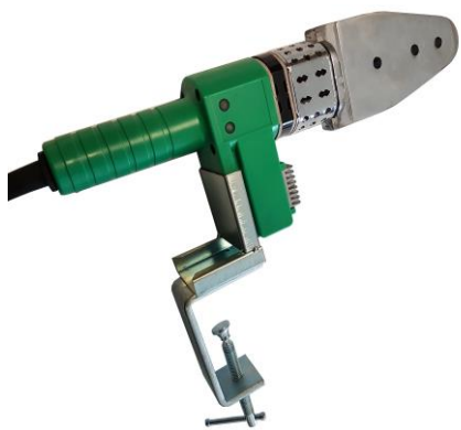
Illustrazione 2: supporto da tavolo con morsa