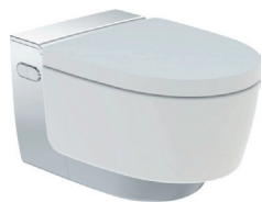
Figura di esempio